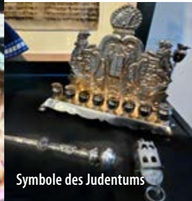
Symbole des Judentums