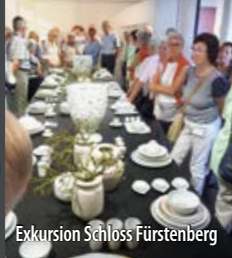
Exkursion Schloss Fürstenberg