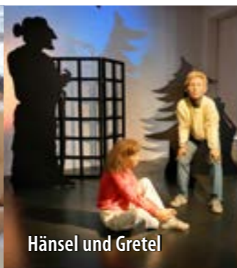
Hänsel und Gretel